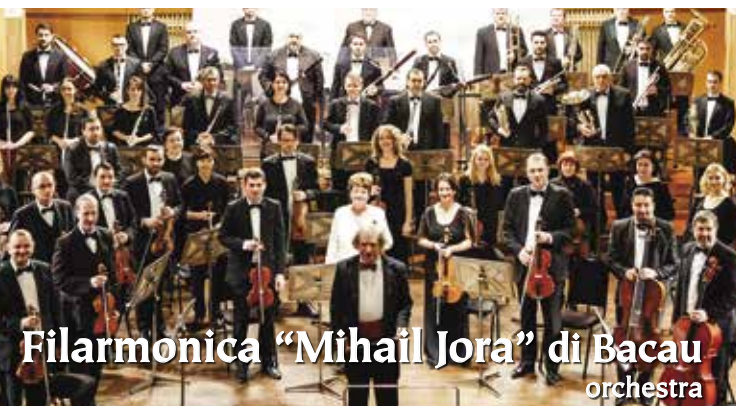
Filarmonica "Mihail Jora" di Bacau orchestra