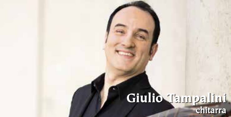
Giulio Tampalini chitarra

G iulio Tampalini è nato a Brescia il 19 novembre 1971. Ha vinto i maggiori premi internazionali di chitarra, come il Concorso “Yepes” di Sanremo (presidente di giuria Narciso Yepes), il “Sor” di Roma, due volte il Tim, Torneo Internazionale di Roma nel 1996 e nel 2000, il “De Bonis” di Cosenza, secondo premio al “Pittaluga” di Alessandria e al “Segovia” di Granada. Nel 2003 ha ricevuto la Chitarra d’oro per il miglior cd (Tárrega: Opere complete per chitarra, Musicmedia). Si esibisce regolarmente in tutta Europa, Asia e Stati Uniti come solista e con orchestra. Nella sua imponente discografia sono presenti cd dedicati al Novecento italiano, un cofanetto con l’opera completa per chitarra sola di Castelnuovo-Tedesco, il Concierto de Aranjuez di Rodrigo, l’opera omnia di Tárrega, un monografico su Gilardino, le Sei Rossiniane di Giuliani, il Concerto n. 1 , il Quintetto e il Romancero Gitano di Castelnuovo-Tedesco, l’integrale di Llobet e un dvd con l’integrale per chitarra sola di Villa-Lobos. Dal 2017 è artista Warner Classics per la quale ha registrato l’album “The Spanish Guitar”. Giulio Tampalini è docente di chitarra presso il Conservatorio di Adria, direttore artistico dell’Accademia della chitarra di Brescia e tiene seguitissime masterclass in tutta Italia e in Europa. Nel 2014 ha ricevuto a Milano il Premio delle Arti e della Cultura. Suona una chitarra del liutaio inglese Philip Woodfield.