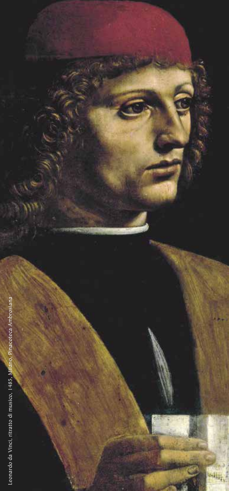
Leonardo da Vinci, ritratto di musico, 1485, Milano, Pinacoteca Ambrosiana